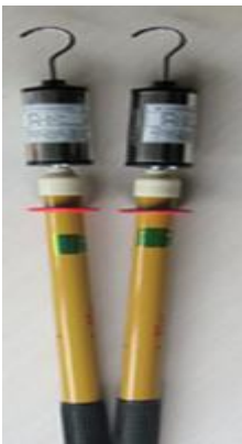
图 1 数字无线核相器发射器

接受器为手持式仪器，带有内置天线，用于接收发射器发送过来的数字信号。接收到发射器发射的相位信号后，经分析处理后，将频率、电压波形和相位差显示在 LCD 上。