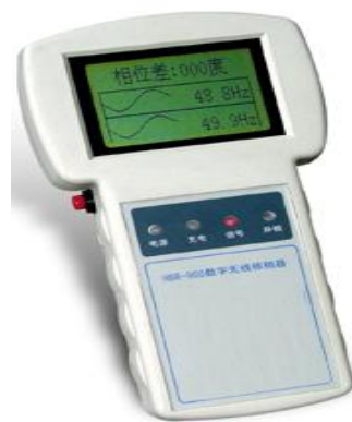
图 2 数字无线核相器接收器

发射器是电压探测器和发射器的联合装置，首先判断线路是否带电，然后发出有关导体相位的信号。接收器，获得发射器发出的信号，然后在测试时用信号通知用户导体达到了同相。